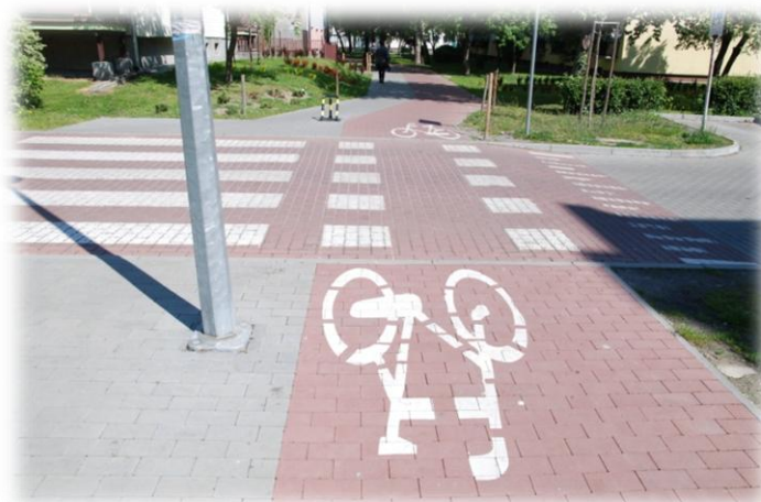
Foto.42. DI wewnętrzna droga osiedlowa (Spółdzielnia Mieszkaniowa)