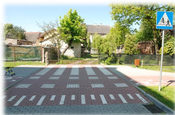
Foto.46. DI wewnętrzna droga osiedlowa (Spółdzielnia Mieszkaniowa)