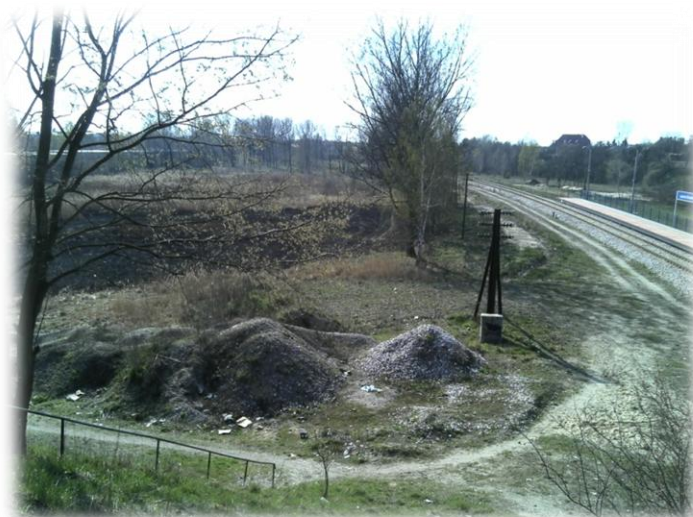
Foto.34. Droga inna wzdłuż torów kolejowych (w kierunku zachodnim)