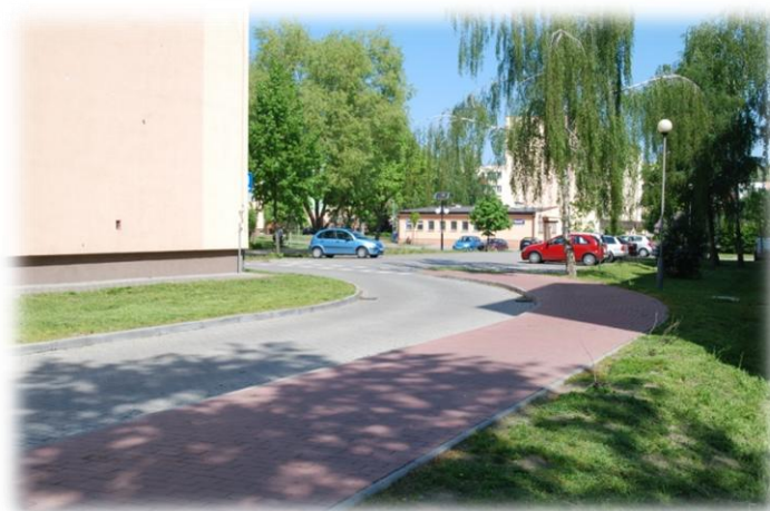
Foto.36. DI wewnętrzna droga osiedlowa (Spółdzielnia Mieszkaniowa)