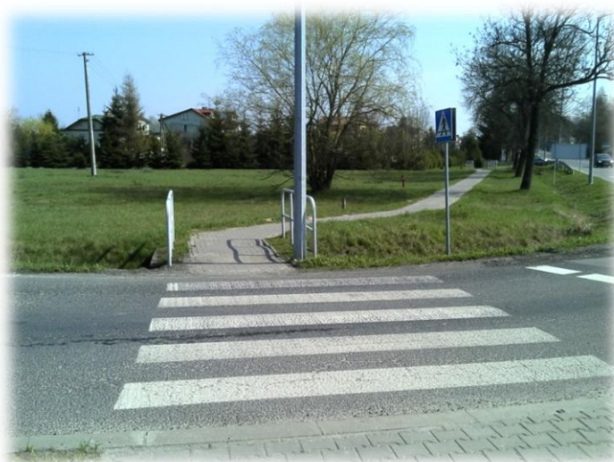
Foto.6. Przejście dla pieszych przez DK 19 (w kierunku wschodnim)