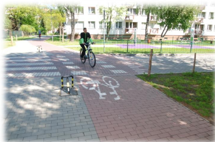
Foto.44. DI wewnętrzna droga osiedlowa (Spółdzielnia Mieszkaniowa)