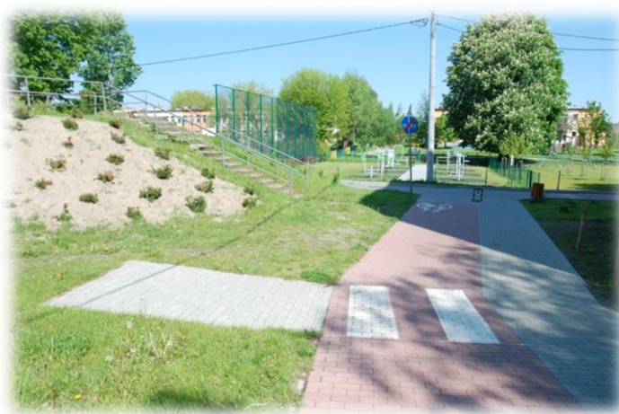
Foto.56. DI wewnętrzna droga osiedlowa (Spółdzielnia Mieszkaniowa)