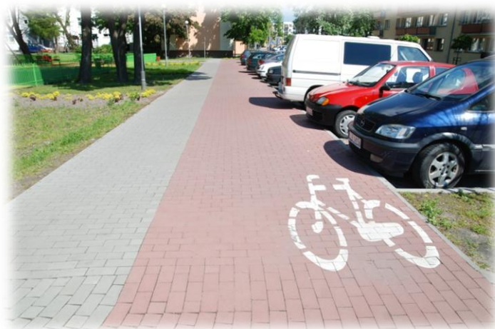
Foto.49. DI wewnętrzna droga osiedlowa (Spółdzielnia Mieszkaniowa)