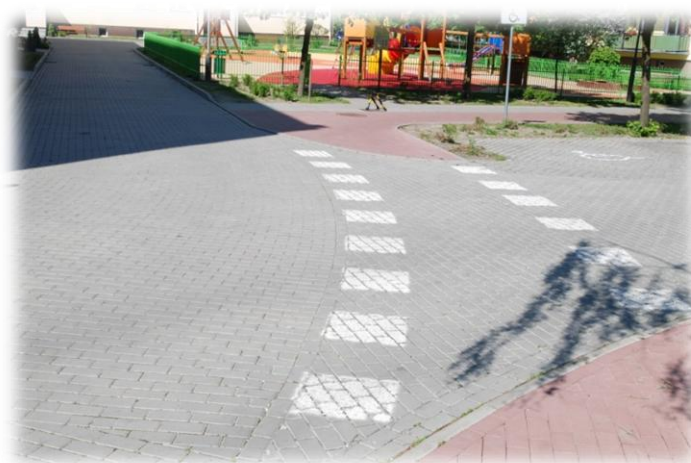
Foto.37. DI wewnętrzna droga osiedlowa (Spółdzielnia Mieszkaniowa)