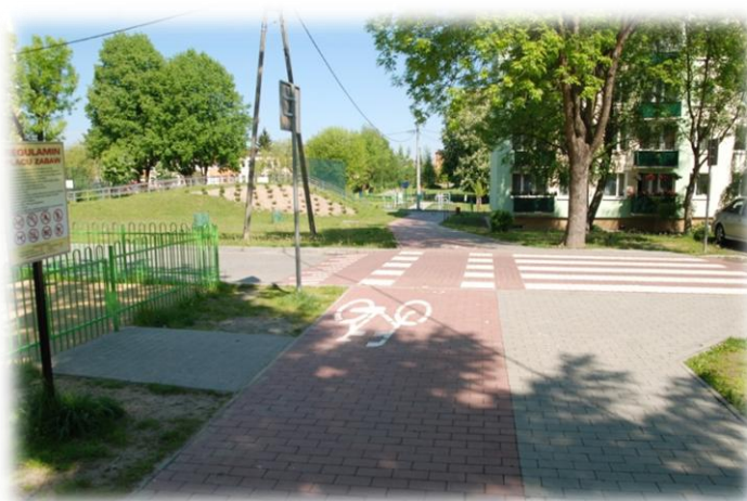
Foto.55. DI wewnętrzna droga osiedlowa (Spółdzielnia Mieszkaniowa)