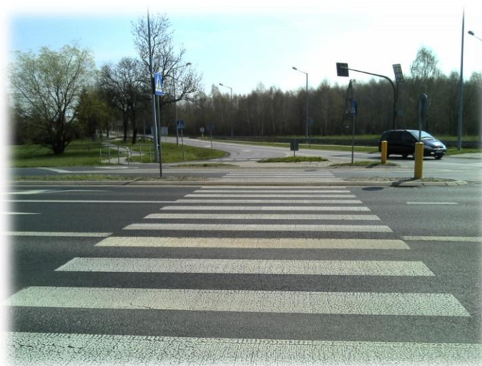
Foto.5. Przejście dla pieszych przez DK 19 (w kierunku wschodnim)