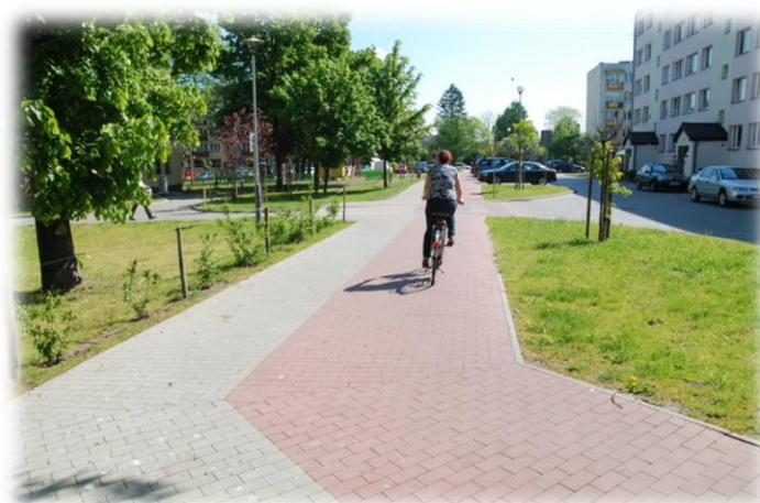
Foto.47. DI wewnętrzna droga osiedlowa (Spółdzielnia Mieszkaniowa)