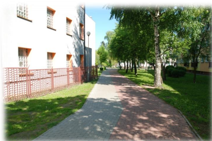
Foto.43. DI wewnętrzna droga osiedlowa (Spółdzielnia Mieszkaniowa)