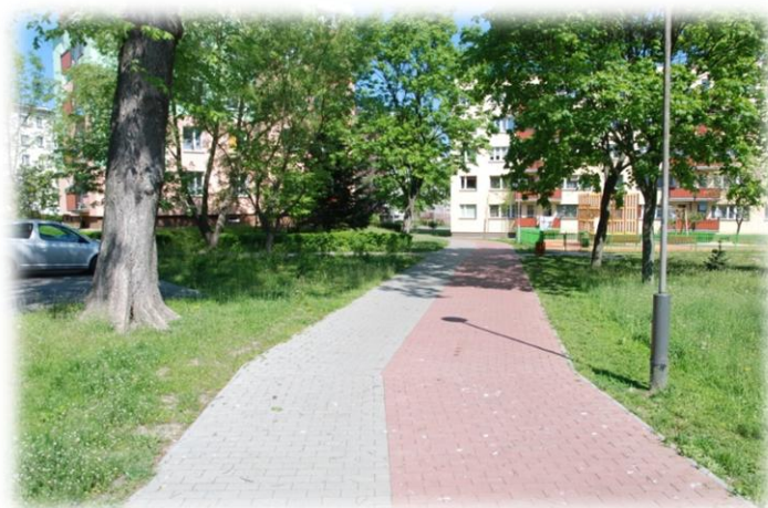
Foto.39. DI wewnętrzna droga osiedlowa (Spółdzielnia Mieszkaniowa)