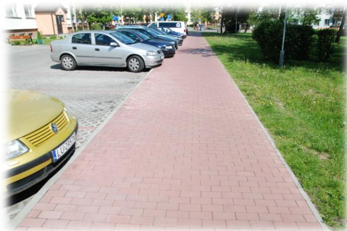
Foto.50. DI wewnętrzna droga osiedlowa (Spółdzielnia Mieszkaniowa)