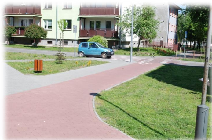
Foto.41. DI wewnętrzna droga osiedlowa (Spółdzielnia Mieszkaniowa)