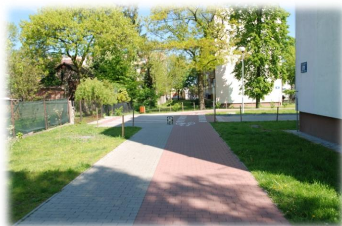
Foto.45. DI wewnętrzna droga osiedlowa (Spółdzielnia Mieszkaniowa)