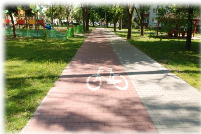
Foto.54. DI wewnętrzna droga osiedlowa (Spółdzielnia Mieszkaniowa)