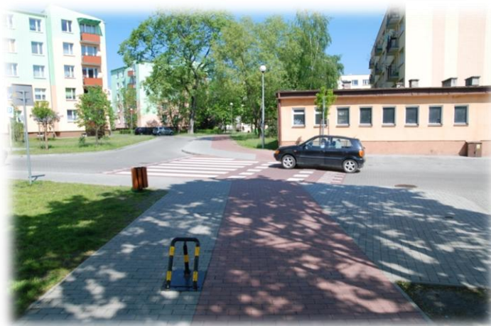
Foto.38. DI wewnętrzna droga osiedlowa (Spółdzielnia Mieszkaniowa)