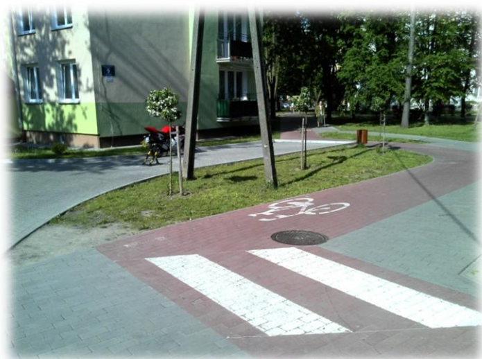
Foto.53. DI wewnętrzna droga osiedlowa (Spółdzielnia Mieszkaniowa)