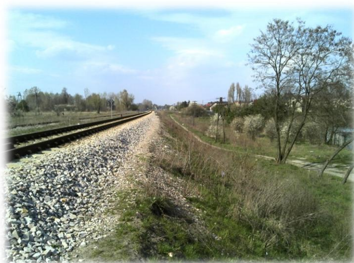
Foto.32. Droga inna wzdłuż torów kolejowych (w kierunku północnym)