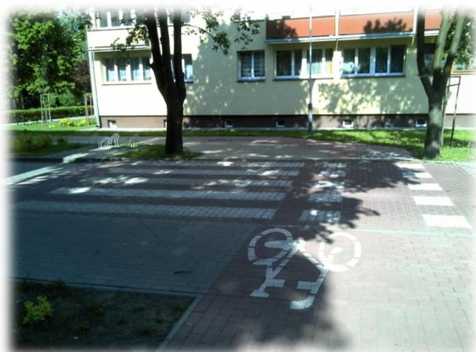
Foto.51. DI wewnętrzna droga osiedlowa (Spółdzielnia Mieszkaniowa)