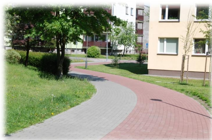
Foto.40. DI wewnętrzna droga osiedlowa (Spółdzielnia Mieszkaniowa)