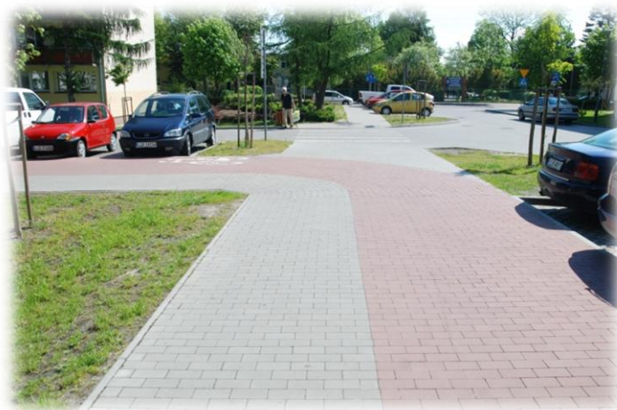
Foto.48. DI wewnętrzna droga osiedlowa (Spółdzielnia Mieszkaniowa)