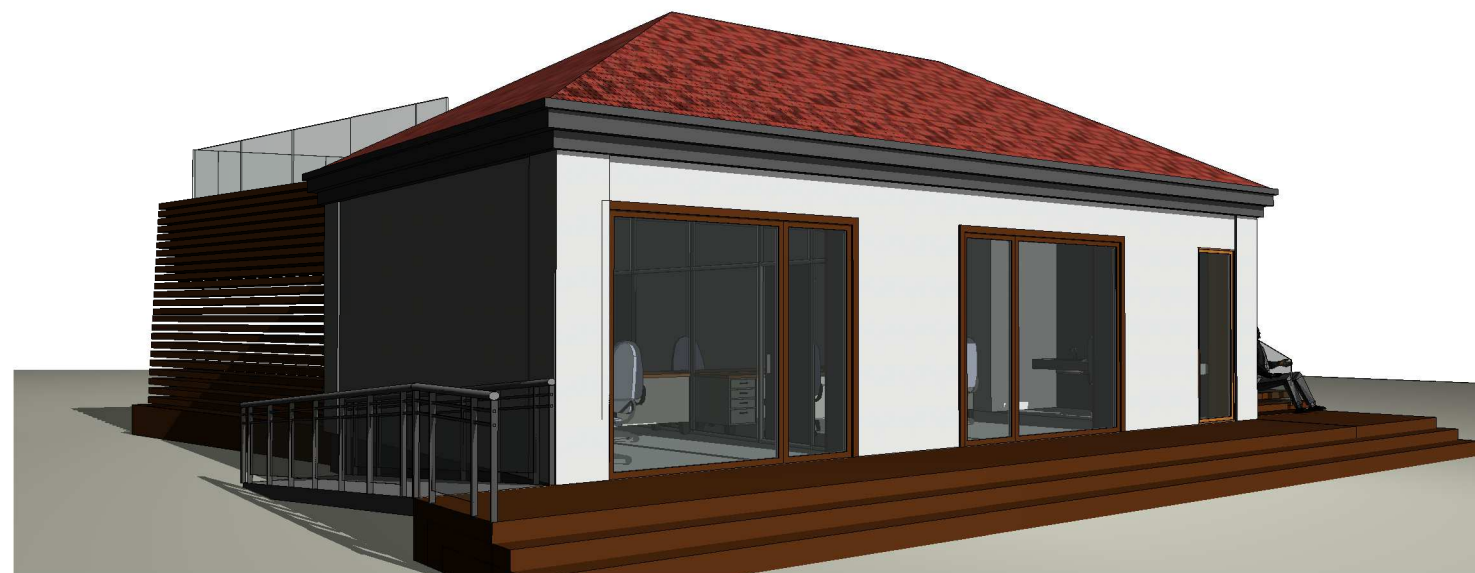
Widok 3D 8