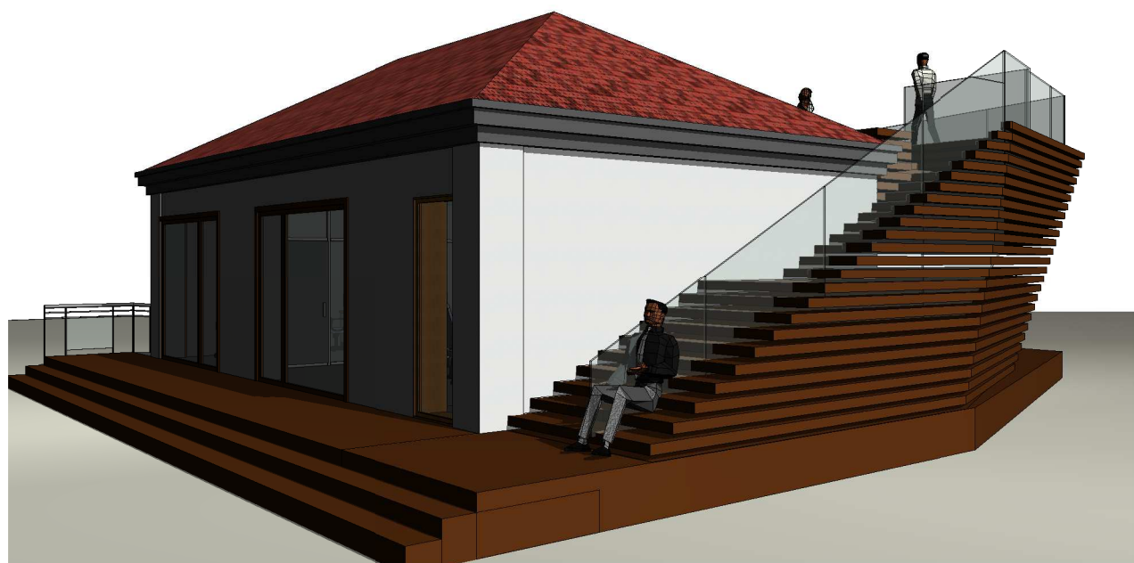
Widok 3D 6