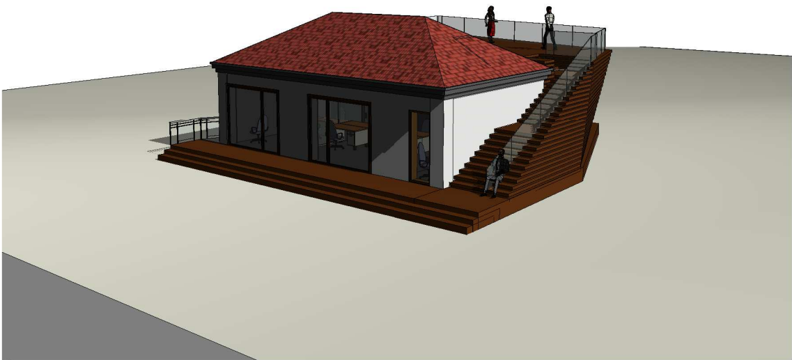
1 Widok 3D 1